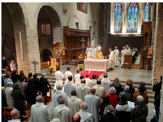
Messe chrismale 11 avril avec une soixantaine de prêtres, diacres et laïcs en mission au cœur des diocèses de Chambéry, de Maurienne et de Tarentaise