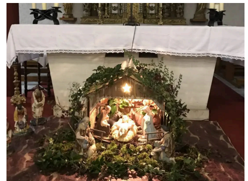
Chapelle Notre-Dame-du-Ski à la Toussuire