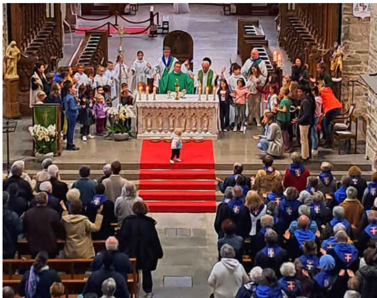
La prière du Notre Père avec les enfants lors de la messe

Dimanche 15, les enfants du caté et de l'aumônerie des paroisses de Saint-Michel, Valloire et Saint-Jean-de-Maurienne se sont retrouvés pour la messe dominicale. Après un pique-nique dans le cloître, ils ont visité en groupes la cathédrale, la crypte et découvert les reliques. Pour clôturer leur rencontre, ils ont chanté avec le Père André dans la cathédrale. Ce même jour, les hospitaliers de Notre-Dame-de-Lourdes de Maurienne se réunissaient pour leur Assemblée Générale qui a lieu à la Maison Saint Jean-Baptiste. Une journée bien remplie à la paroisse !