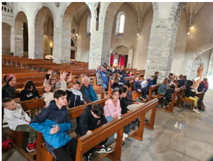
Le temps de prière et de chant à la fin de la journée