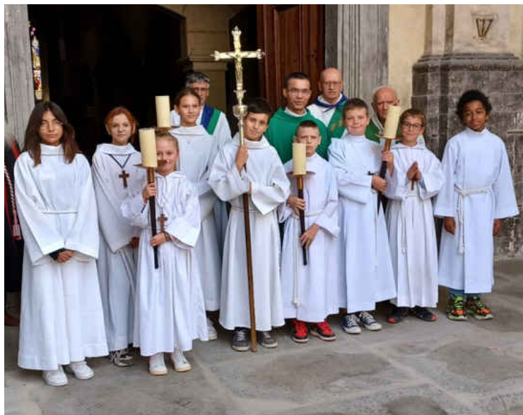
Les servants de messe