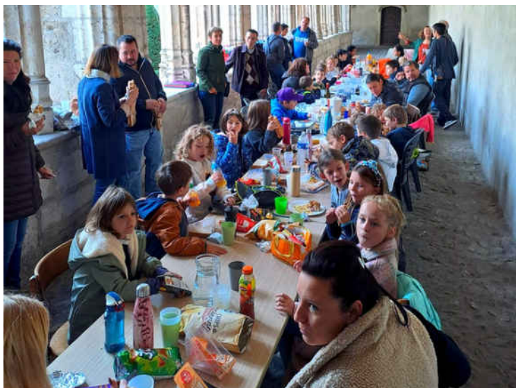
Le repas des enfants dans le cloître